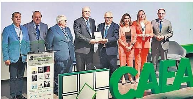
La consejera de Empleo, Empresa y Trabajo Autónomo de la Junta de Andalucía, Rocío Blanco, clausura unas jornadas organizadas por el CAEA.