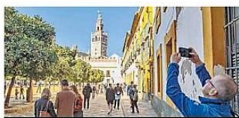
El Patio de Banderas.

"La terraza tiene rincones y, seguramente, se quedó tras algún punto de no visión cuando repasaron para cerrar", concluyeron desde Sevilla City Office. El edificio forma parte del Bien de Interés Cultural (BIC) del Alcázar y conserva "elementos arqueológicos de gran valor", tal y como recoge la Fundación Biodiversidad en su página web. Entre sus atractivos destacan la azotea de 155 metros cuadrados con vistas a la Giralda, el Patio de Banderas y el barrio de Santa Cruz.