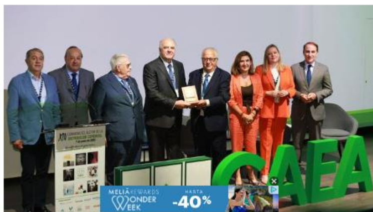
Foto de familia tras las jornadas con el premiado en el centro.