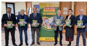
La presentación de la campaña 'El valor de mi súper'.

La distribución alimentaria reivindica su carácter esencial con la campaña 'El valor de mi súper'