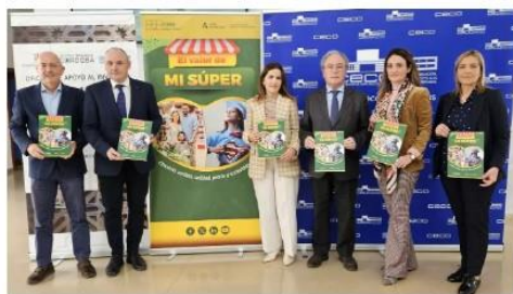
Imagen de la presentación de la campaña. / CÓRDOBA

El I Premio CAEA de Comunicación reconoce a la mejor información sobre el sector de la distribución comercial de gran consumo en Andalucía publicada en 2023