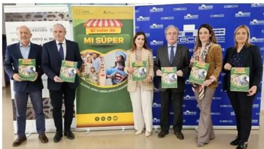
Presentación de la campaña 'El valor de mi súper'.