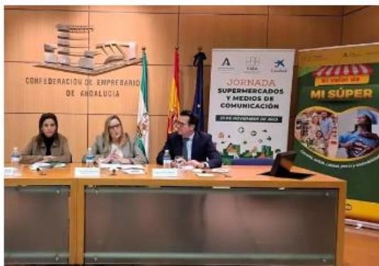
La sede de la Confederación de Empresarios de Andalucía (CEA) ha acogido la jornada 'Supermercados y Medios de Comunicación', organizada por la Confederación Andaluza de Empresarios de Alimentación y Perfumería (CAEA).