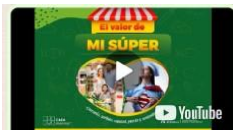
Video Campaña CAEA "El valor de mi súper"

https://youtu.be/CXso3FGMSP8?si=EbUR7SA2bSHacPFc