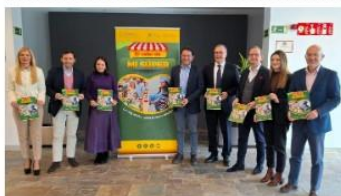
Presentación de la campaña.