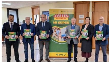
Campaña 'El valor de mi súper' / M.C. (Huelva)