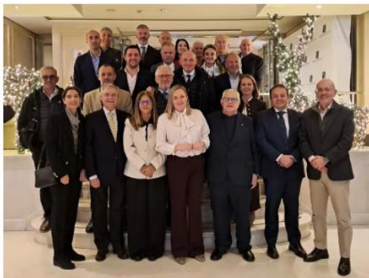
Junta Directiva de CAEA reunida el 27 de noviembre de 2025.

La Confederación Andaluza de Empresarios de Alimentación y Perfumería (CAEA) ha presentado el 'Estudio análisis sobre la pérdida desconocida en el sector retail de alimentación, gran consumo y perfumería en Andalucía'