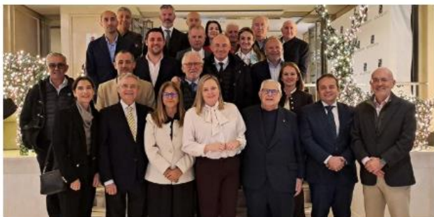
Junta Directiva de CAEA.

La pérdida desconocida, que incluye hurtos externos, internos y errores administrativos o de proveedores, representó un 0,9% de la facturación total de las empresas del sector del comercio de alimentación, gran consumo y perfumería en Andalucía en el año 2024.