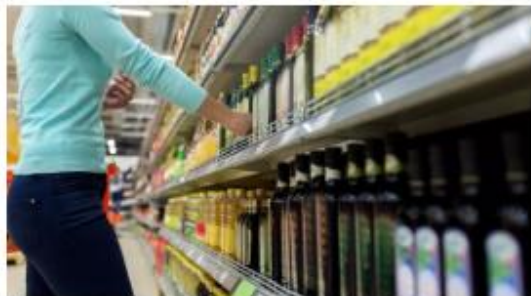
Una imagen de archivo de acceso de libre en un supermercado.

"No se trata de hurtos o robos familiares o por necesidad, sino de bandas organizadas que han hecho de esto su modo de vida", apunta un informe de CAEA - Málaga representa un 17% de supermercados de la comunidad