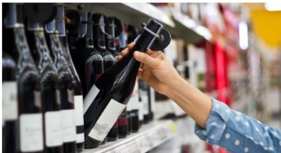
Botella de vino en el lineal de un supermercado