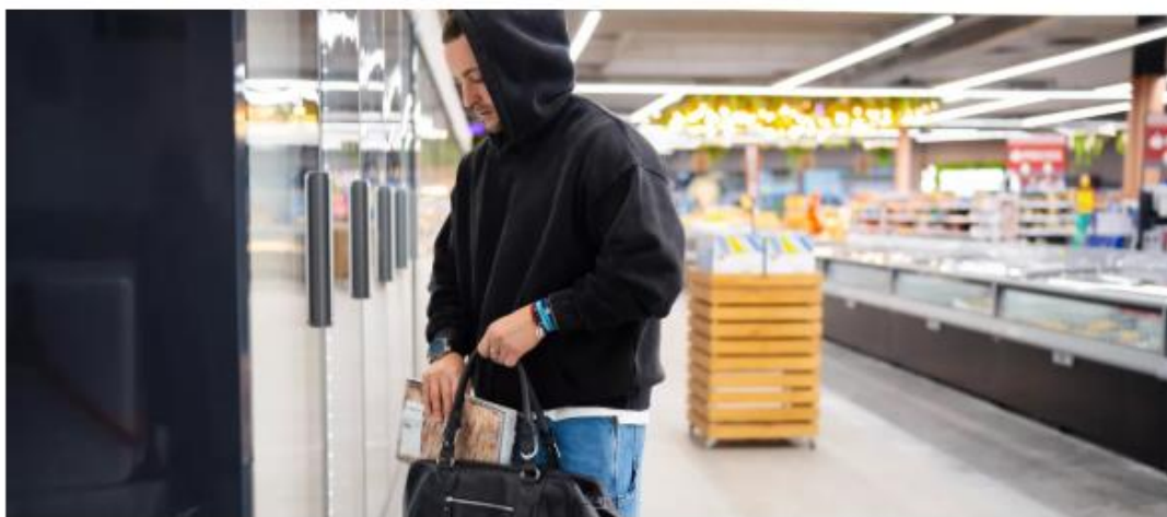
Robo en un supermercado - Checkpoint